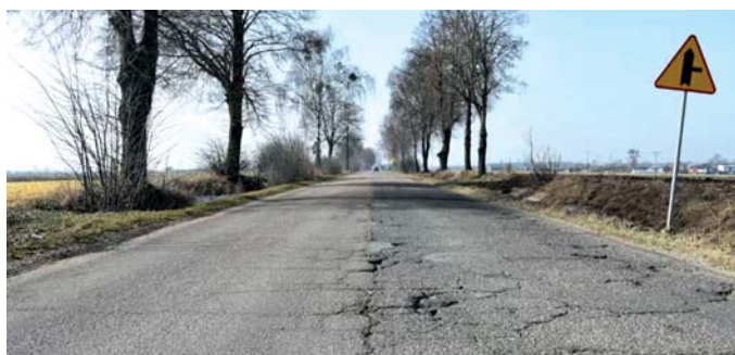
Remont drogi powiatowej nr 3743W Zawidz - Osiek - Włostybory - Koziebrody - Raciąż