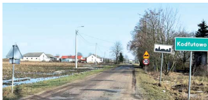
Remont drogi powiatowej nr 4639W Krzeczanowo - Kodłutowo