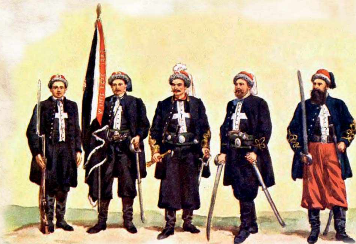
Żołnierze Powstania Styczniowego – Żuawi Śmierci, w jednolitym umundurowaniu i uzbrojeniu.