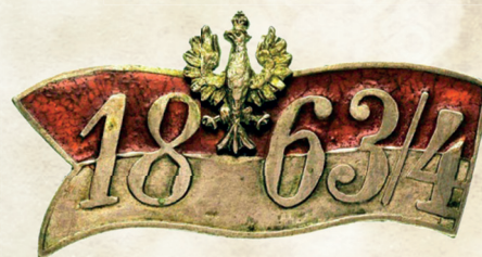
„MOJA MAŁA OJCZYZNA” Artur Zybala Jeżewo - Wesel 2021