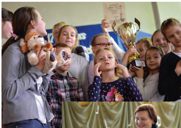
Laureaci pierwszej nagrody