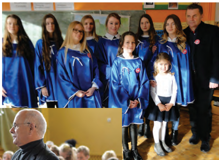
Reprezentant gospodarzy – schola z Gralewa