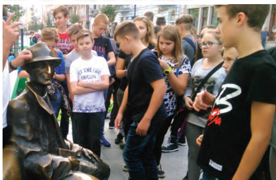
Uczniowie z Koziebrod przy ławeczce Juliana Tuwima na ul. Piotrkowskiej w Łodzi