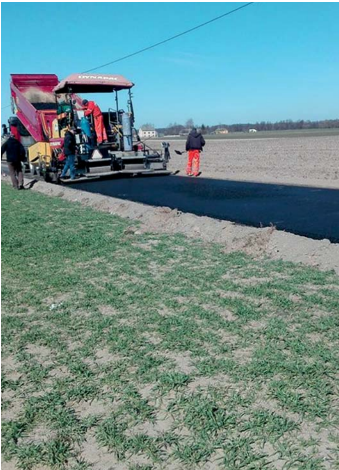
Budowa drogi w Kossobudach...