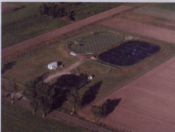
Oczyszczalnia ścieków w Koziebrodach – widok z góry

Teraz trwa budowa oczyszczalni ścieków dla Graliewa i Szapska. Sieć kanalizacyjna, która doprowadzi do niej ścieki, jest już gotowa. Ma ponad 7 km długości. Jeszcze w tym roku ma być też gotowa oczyszczalnia. Będzie w niej wykorzystywana metoda osadu czynnego w układzie SBR (reaktory cykliczne). Układ SBR zapewnia biolo-