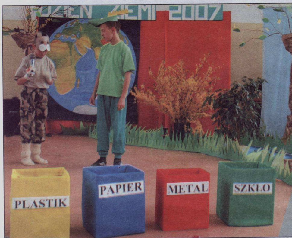
W tym roku apel w Dniu Ziemi miał w Uniecku formę bajki

Edukacja ekologiczna dotyczy nie tylko dorosłych mieszkańców, lecz także, a może przede wszystkim, dzieci i młodzieży. W szkołach organizowane są konkursy ekologiczne, seanse filmowe, koncerty, imprezy okolicznościowe. Młodzież bierze udział w akcji „Sprzątanie świata”. W Dniu Ziemi odbywają się specjalne apele. Na przykład w Zespole Szkół w Uniecku od wielu lat uczniowie