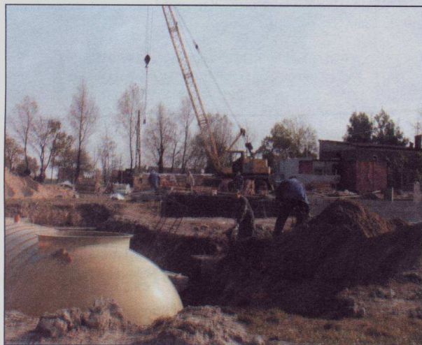
Budowa oczyszczalni ścieków w Graliewie

W gminie Raciąż od kilku lat funkcjonuje biologiczno-mechaniczna oczyszczalnia ścieków, zlokalizowana na obrzeżach wsi Koziebrody, o wydajności 125 metrów sześciennych na dobę. Jej podstawowymi urządzeniami są staw napowietrzający i staw doczyszczający. Ponadto jest wyposażona w punkt zlewny do przyjmowania ścieków dowożonych. Głównie jednak ścieki trafiają do oczyszczalni siecią kanalizacyjną. Jej długość przekracza 15 kilometrów. Sieć dociera do gospodarstw i domostw w Koziebrodach, Małej Wsi, Niedrożu i Druchowie.