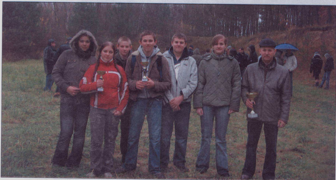
Reprezentacja Gimnazjum w Koziębrodach – mistrz gminy

NOWO OTWARTY SALON OPTYCZNO – OKULISTYCZNY ZAPRASZA