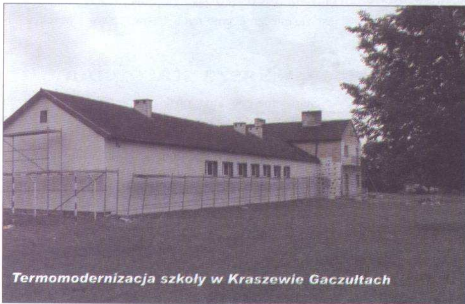
Termomodernizacja szkoły w Kraszewie Gaczułtach

Urząd Gminy Raciaż przypomina, że z końcem 2007 roku upływa termin wymiany książeczkowych dowodów osobistych. Dnia 01.01.2008 roku dowody te tracą ważność i dokonanie jakiegokolwiek czynności na ich podstawie będzie niemożliwe.