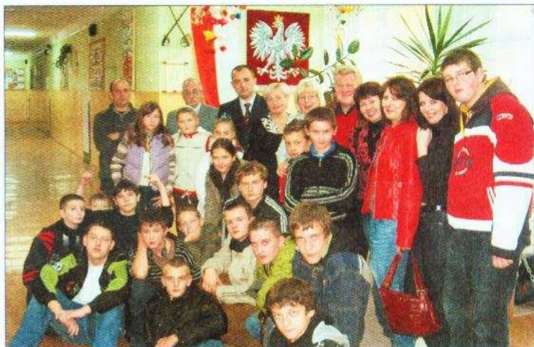
Pamiątkowa fotografia podczas wizyty w szkole w Gralewie

Organizatorzy zadbali, aby spędzony czas był mile zapamiętany. Dzieci brały udział w lekcjach języka polskiego, angielskiego i innych przedmiotów w Zespole Szkół w Uniecku. Uczestniczyły w uroczystości pasowania na uczniów gimnazjum tych, którzy rozpoczęli naukę w szkole we wrześniu, a na-