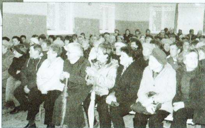
Spotkanie w sprawie funkcjonowania ośrodka zdrowia w Koziebrodach wywołało duże zainteresowanie