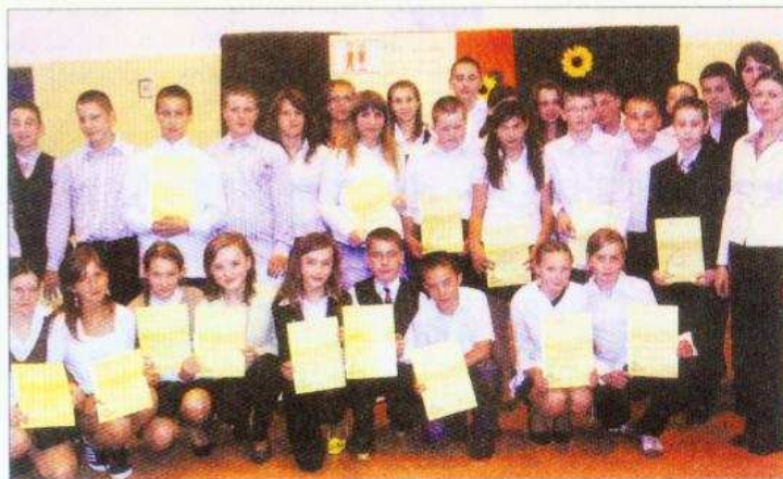
Pierwszoklasiści PG w Uniecku