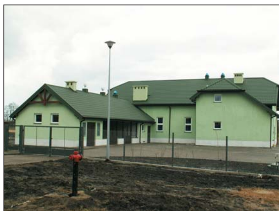
Oczyszczalnia w Gralewie, jedna z trzech zbiorczych oczyszczalni ścieków w gminie Raciąż

Może zabrzmi to paradoksalnie, ale rozwój wsi z miastem wyszedł tej pierwszej na dobre. Z perspektywy 20 lat widać wyraźnie, jak trafna i korzystna dla środowiska wiejskiego była to decyzja. Przez ten czas powstały kilometry wodociągów, dzięki czemu woda z ujęć głębinowych dociera do niemal wszystkich po-