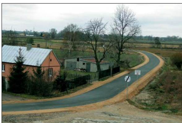
Dziesiątki, jeśli nie setki kilometrów gminnych traktów otrzymało nawierzchnię asfaltową

Mowa o gminie Raciąż na Mazowszu, największej obszarowo jednostce samorządowej w powiecie płońskim.