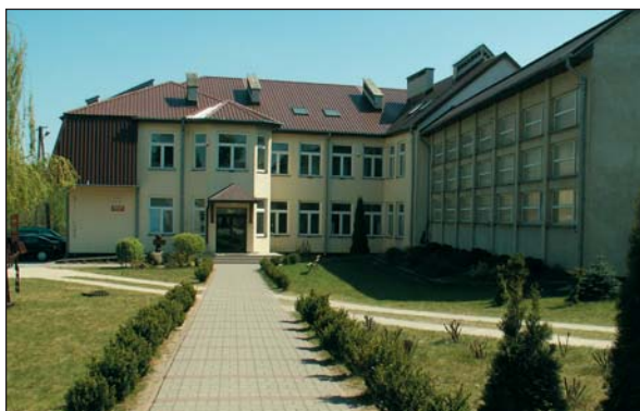
Zmodernizowano i rozbudowano placówki oświatowe, także szkołę w Unieku

Powstała na skutek woli większości radnych miejsko-gminnej wówczas rady, która doprowadziła do utworzenia nowej samodzielnej jednostki samorządu terytorialnego, odrębnej od miasta Raciąży.