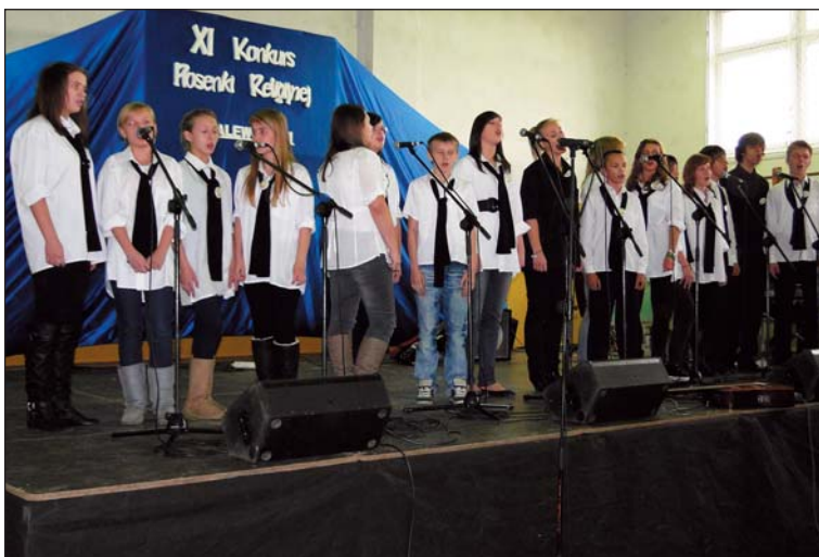
Zespół z Gimnazjum w Głinojocku...