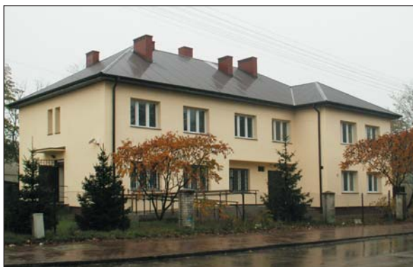
Gmina przejęła od powiatu ośrodki zdrowia, po czym jeden wybudowała od podstaw, a dwa zmodernizowała, jak ten w Koziębrodach