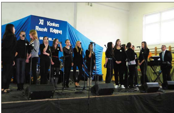
Zespół z Raciąża...