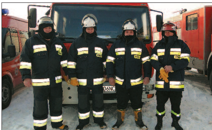
Druhowie OSP Kaczorowy

maszyny objaśniła druhom, jak korzystać z urządzeń głównie przy transportowaniu rannego z wypadku do śmigłowca. Druhowie ćwiczyli też sprowadzanie maszyny na ziemię w ciągu dnia i w nocy.