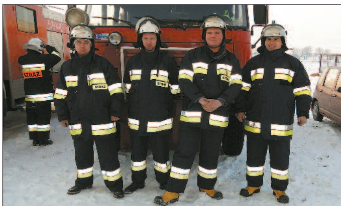
Druhowie OSP Unieck

maszyny objaśniła druhom, jak korzystać z urządzeń głównie przy transportowaniu rannego z wypadku do śmigłowca. Druhowie ćwiczyli też sprowadzanie maszyny na ziemię w ciągu dnia i w nocy.