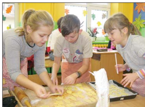
Wiele spotkań klubowicze i wolontariusze poświęcili warsztatom twórczym wykonując ozdoby choinkowe zgodnie z dawną tradycją, robiąc pająki, piekąc ciastka, śpiewając kolędy