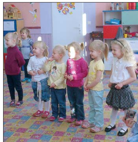
Wszystkie dzieci w Kodłutowie oznajmiły jednogłośnie, że były bardzo grzeczne i zasługują na upominek

6 grudnia do dzieci uczęszczających do Punktu Przedszkolnego w Kodłutowie przyszedł bardzo miły gość. Jak tylko pojawił się w drzwiach w czerwonym ubraniu i z workiem na plecach, dzieci od razu wiedziały, kto to taki i zgodnym chórem zaprosiły gościa do środka. Mikołaj, bo to on był tym gościem, został przyjęty bardzo serdecznie i z ogromnym entuzjazmem. Wszystkie dzieci oznajmiły jednogłośnie, że były bardzo grzeczne i zasługują na upominek. Mikołaj był przygotowany na tę ewentualność, więc każde dziecko otrzymało prezent. Po spotkaniu z gościem dzieci usiadły do słodkiego poczęstunku przygoto-