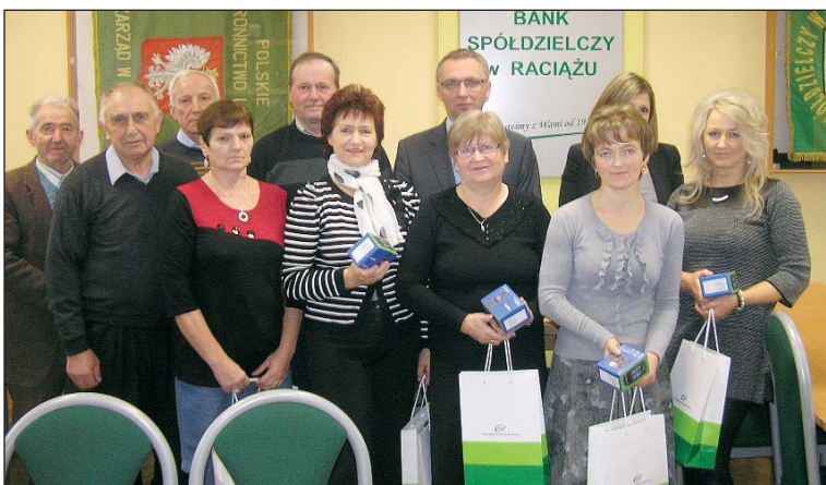
Nagrodzeni telefonami komórkowymi Nokia C5-03

Nagrodą, gwarantowaną wyłącznie dla klientów BS Raciąż w tej edycji loterii, której finał będzie w lipcu 2013 r. – jest samochód osobowy marki Opel Corsa.