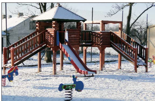
Plac zabaw w Krajkowie

Na przebudowę drogi Kossobudy – Draminek zarząd województwa mazowieckiego przyznał gminie Raciąż dotację w wysokości 50 tys. zł ze środków związanych z wyłączeniem z produkcji gruntów rolnych (FOGR). Inwestycja polegała na wykonaniu robót przygotowawczych i ziemnych, odwodnieniu, podbudowie, wykonaniu nawierzchni dwuwarstwowej, bitumicznej, poboczy, zjazdów i oznakowania drogi. Wartość inwestycji to 525.523,04 zł.