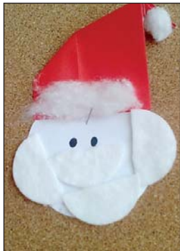
Dzieci w Gralewie wykonały ozdoby na choinkę – mikołaje

6 grudnia w Punkcie Przedszkolnym w Starym Gralewie obchodzone były imieniny Mikołaja . Dzieci zapoznały się z tradycją mikołajek. Otrzymały upominki w postaci słodyczy.