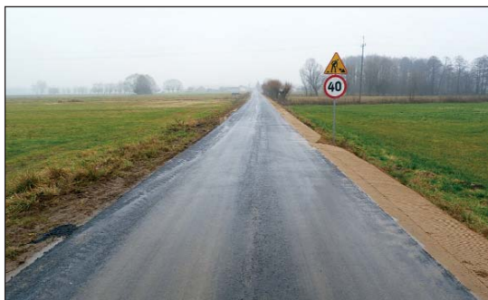
Przebudowana droga Kossobudy – Draminek

Niedawno w gminie Raciąż zakończono nowe inwestycje, w wyniku których przebudowana została droga Kossobudy – Draminek o długości ponad 1,5 km oraz powstały place zabaw w Krajkowie i Gralewie. Ponadto w tej drugiej miejscowości utwardzono teren pod park dawnych maszyn i urządzeń rolniczych.