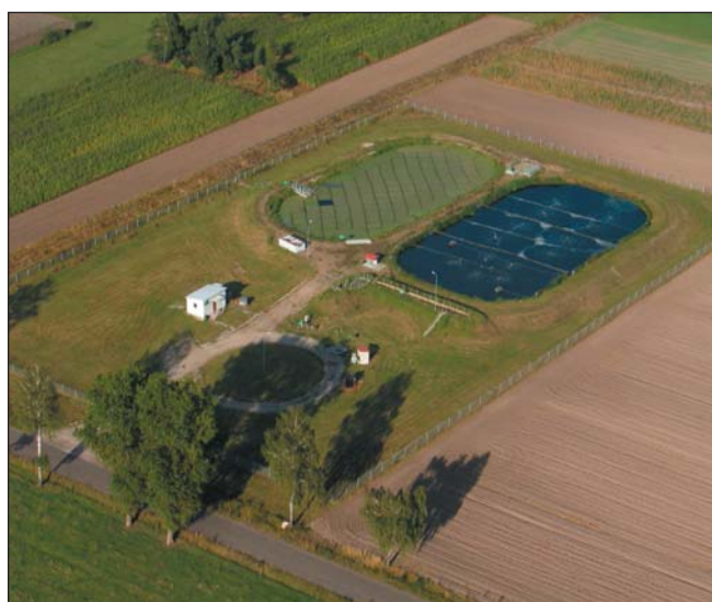
Oczyszczalnia ścieków w Koziebrodach