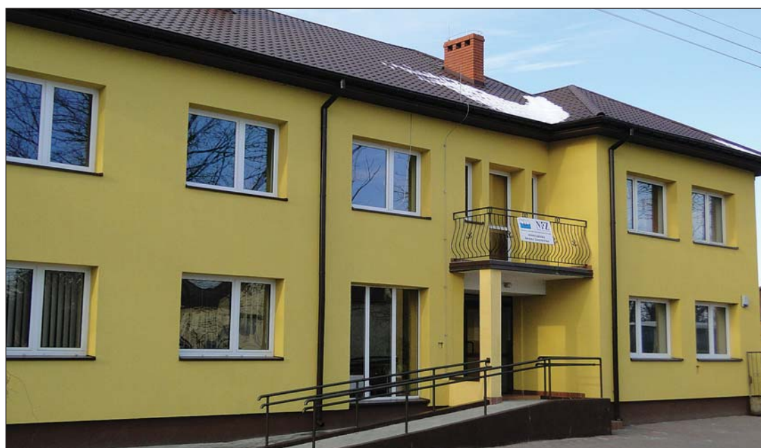
Budynek zmodernizowanego ośrodka zdrowia w Uniecku