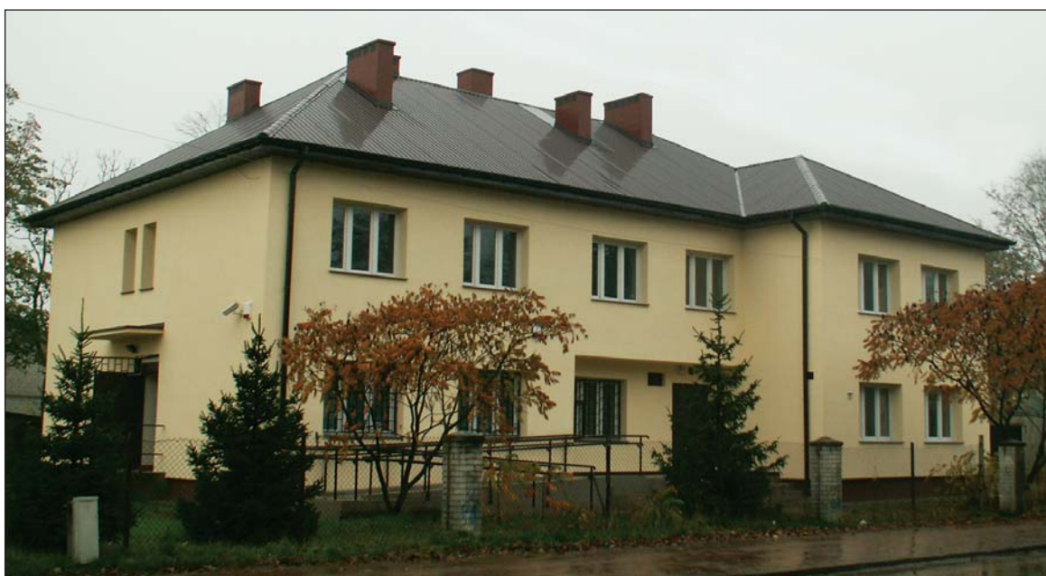
Ośrodek zdrowia w Koziebrodach