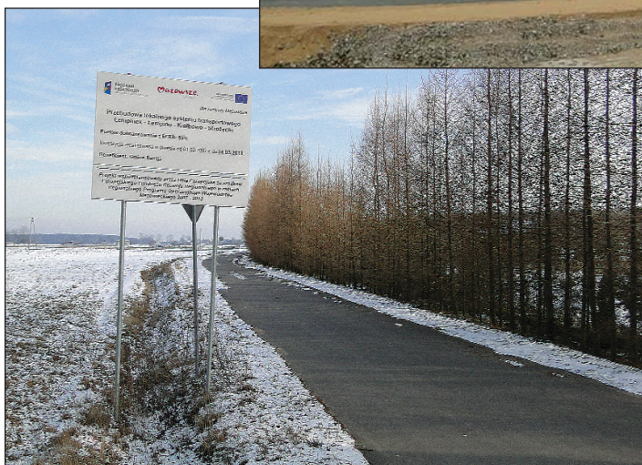
Fragment traktu łączącego „sześćdziesiątkę” z drogą Raciąż – Płońsk