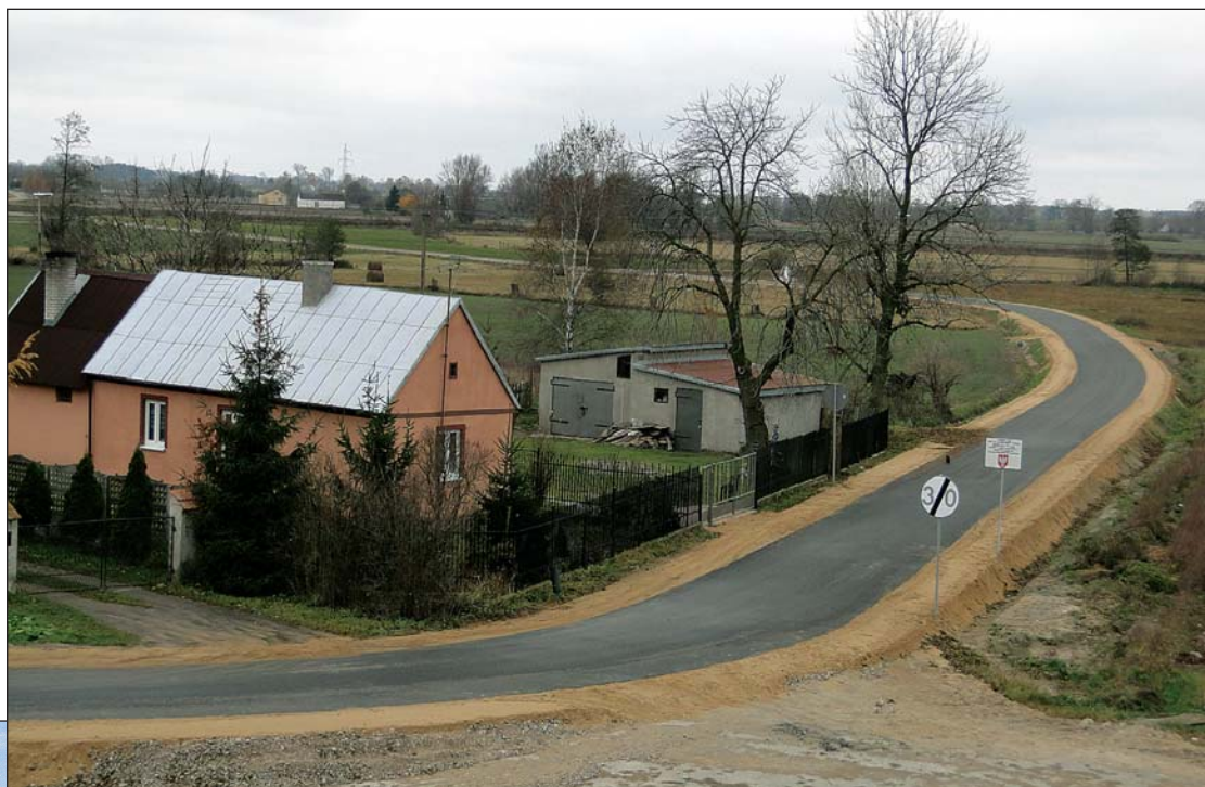
Droga od obwodnicy Raciąża do Witkowa