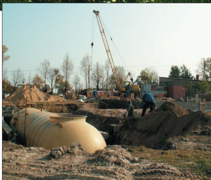
... i w budowie.