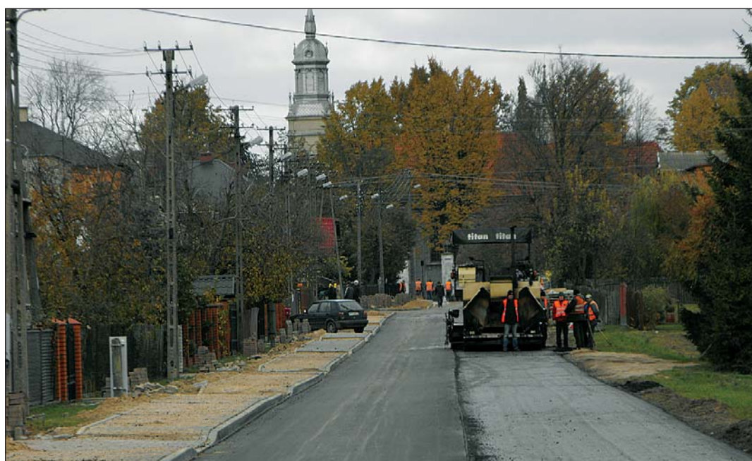
Budowa drogi w Koziebrodach