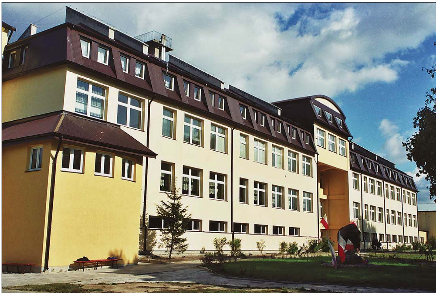
Szkoła w Gralewie