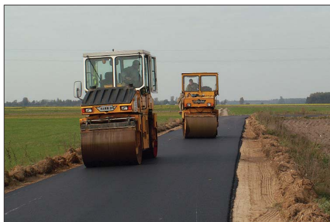
Droga z Folwarku Raciąż do traktu Raciąż – Płońsk