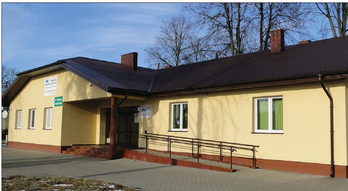
Nowy ośrodek zdrowia w Gralewie