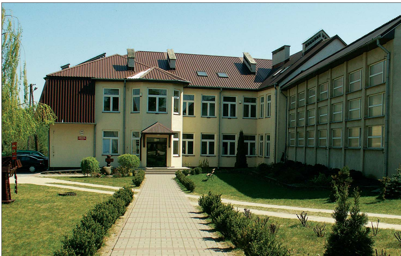
Szkoła w Uniecku