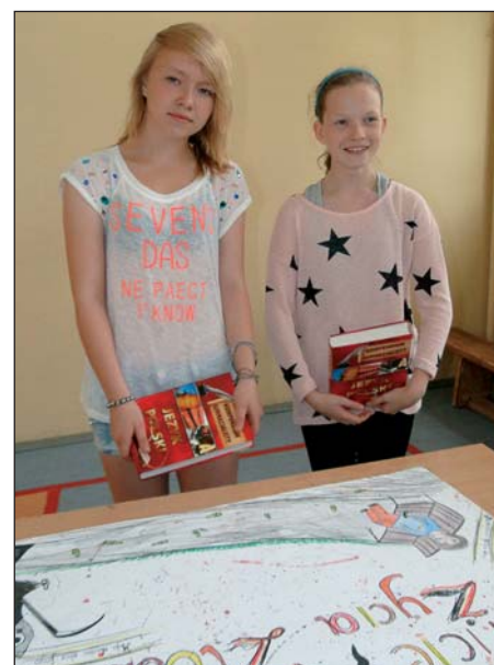
Laureatki konkursu plastycznego w kategorii szkół podstawowych