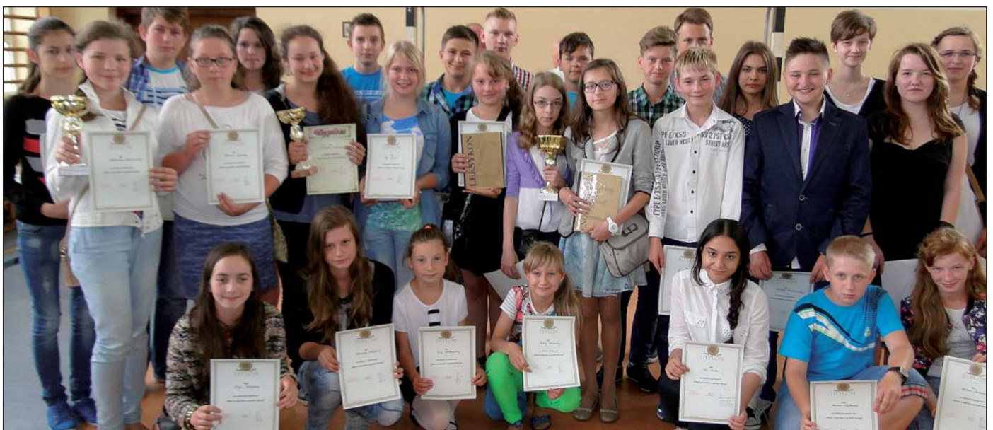
Uczestnicy konkursu wiedzy o gminie