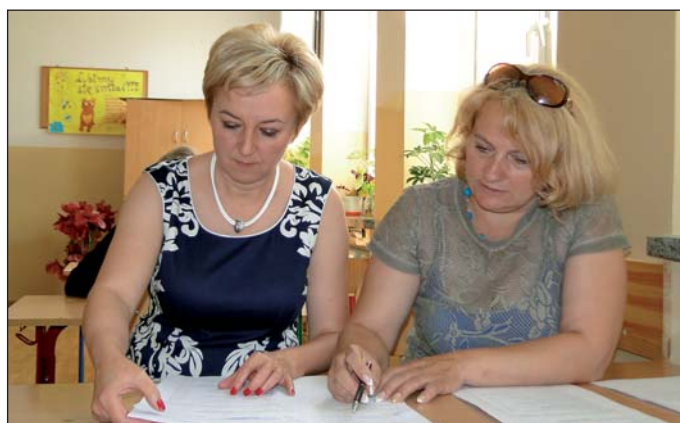
Jurorki sprawdzają testy