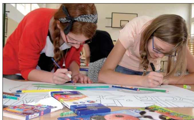
Plastyczki przy pracy