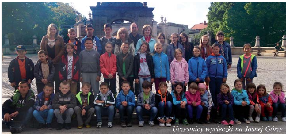
Uczestnicy wycieczki na Jasnej Górze