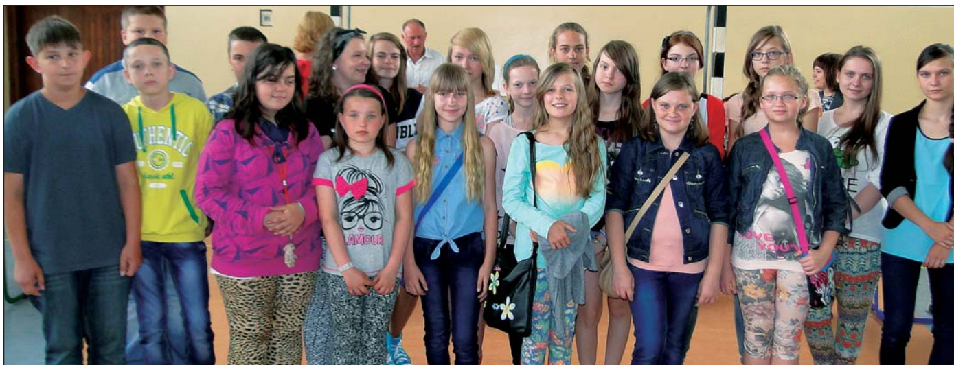
Uczestnicy konkursu plastycznego