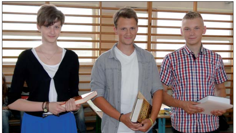
Laureaci konkursu wiedzy o gminie w kategorii gimnazjów