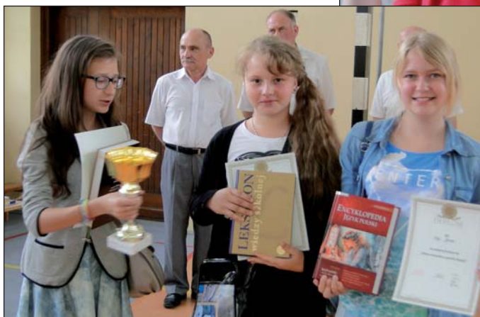
Laureatki konkursu wiedzy o gminie w kategorii szkół podstawowych