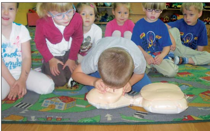
Ćwiczenia praktyczne na fantomach