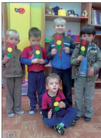
Dzieci z wykonanymi przez siebie sygnalizatorami świetlnymi

Pod koniec maja chętni rodzice wykonali wspólnie z dziećmi pracę plastyczną