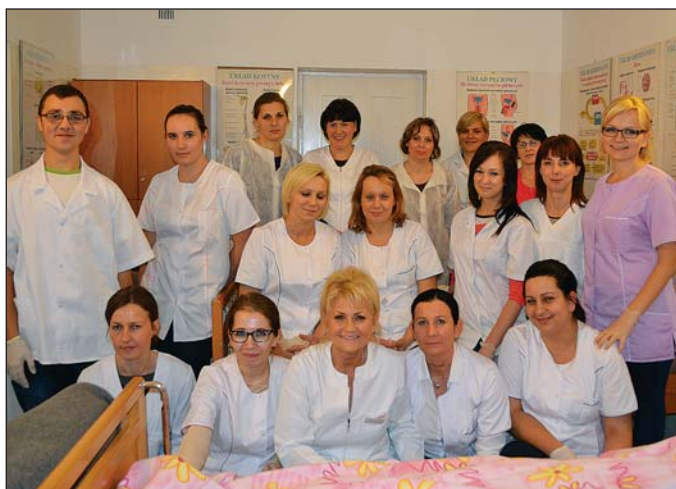
Sluchacze z kierunku opiekun medyczny

Opiekun w domu pomocy społecznej – pierwszy nabór na ten kierunek miał miejsce w roku szkolnym 2013/2014. Nauka trwa 2 lata, czyli 4 semestry. Nowym kierunkiem jest też kształcenie opiekunów medycznych. Nabór na ten kierunek po raz pierwszy odbył się w roku szkolnym 2014/2015. Czas kształcenia to rok, czyli dwa semestry. Podczas zajęć teoretycznych i praktycznych sluchacze dowiadują się, jak w profesjonalny sposób pomóc osobie chorej i niesamodzielnej, zaspokoić jej podstawowe potrzeby bio-psycho-społeczne.