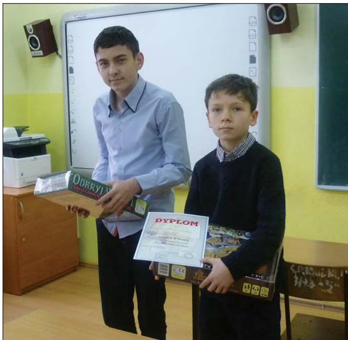
Laureaci w kat. szkół podstawowych

4 marca w Krajkowie 12 gimnazjalistów i 12 uczniów ze szkół podstawowych z dekanatu raciąskiego wzięło udział w konkursie wiedzy religijnej. Laureaci konkursu będą reprezentować dekanat raciąski w finale diecezjalnym.