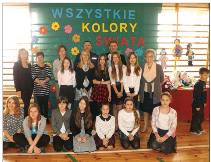
Na zdjęciach uczestnicy akademii

Zaangażowanie dzieci w akcję przerosło nasze najsmielwsze oczekiwania. Powstały wspaniałe szmacianki, każda z nich „radośnie patrzyła na świat”. Tak przygotowane laleczki stały się symbolem pomocy dzieciom w Sudanie Południowym. Ze-