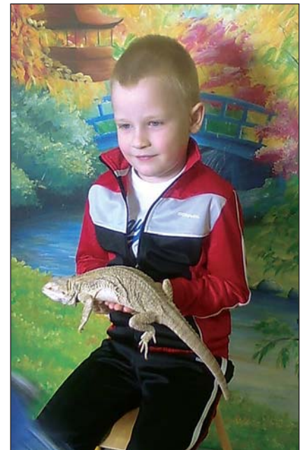
Dzieci mogły dotknąć jaszczurkę oraz zrobić sobie pamiątkowe zdjęcie

wały niektóre fakty z życia zwierząt. Najmilszym punktem wizyty była możliwość poznania „Ludwika”, czyli jaszczurki – agamy brodatej, która przyjechał wraz z panią na pokaz.