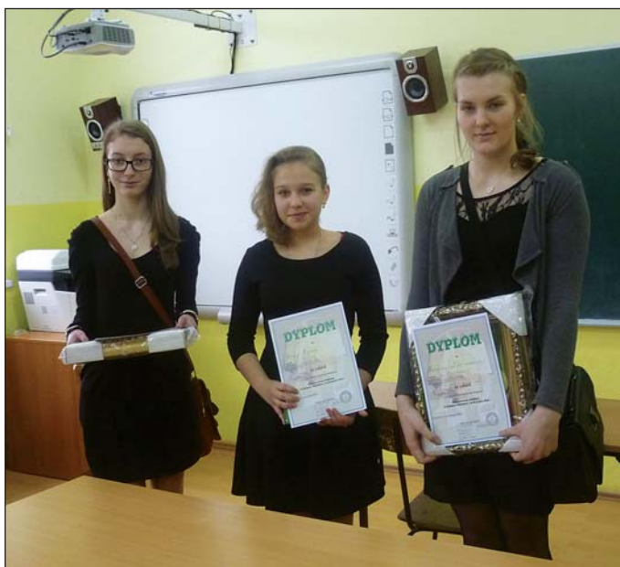
Laureatki w kat. gimnazjów