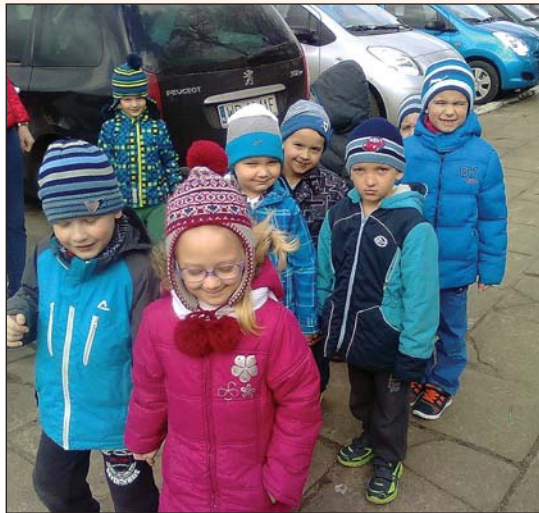
12 marca – pierwszy przedwiosenny spacer po najbliższej okolicy

11 marca przedszkole odwiedziła pani z ogrodu zoologicznego w Płocku. Przedstawiła informację multimedialną o jego mieszkańcach. Dzieci rozwiązywały zagadki i pozna-