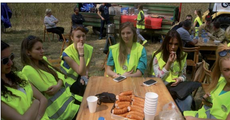
Zasłużony odpoczynek i posiłek