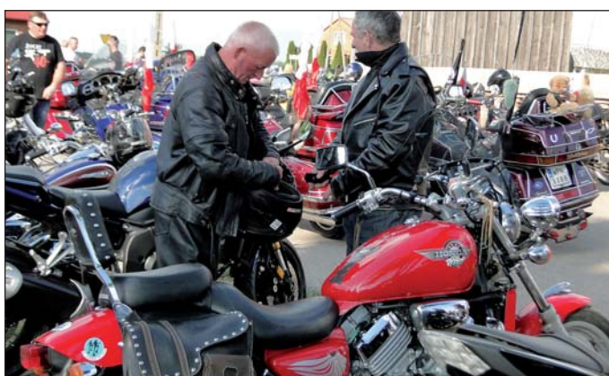
Przygotowania do startu