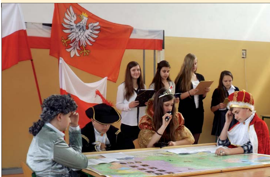
Uczniowie Zespołu Szkół w Uniecku przygotowali apel z okazji 224 rocznicy uchwalenia Konstytucji 3 Maja

Pod takim hasłem odbył się apel z okazji 224 rocznicy uchwalenia Konstytucji 3 Maja, który przygotowali uczniowie Zespołu Szkół w Uniecku.