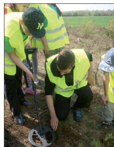
Czy uda się znaleźć pozostałości po I wojnie światowej?