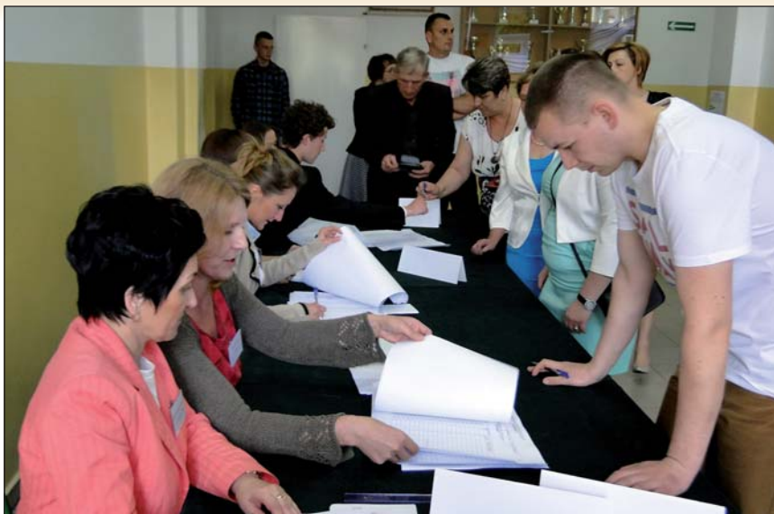
Lokal wyborczy w szkole w Uniecku

było 71.214 uprawnionych do głosowania. Z tego prawa skorzystało 48,73 proc. wyborców. Andrzej Duda otrzymał 21.544 głosy (62,85 proc.), Bronisław Komorowski - 12.735 (37,15 proc.).