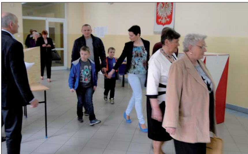
Najwięcej osób głosowało przed i po nabożeństwach