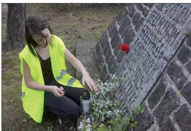
Na cmentarzu wojennym w Pęśach