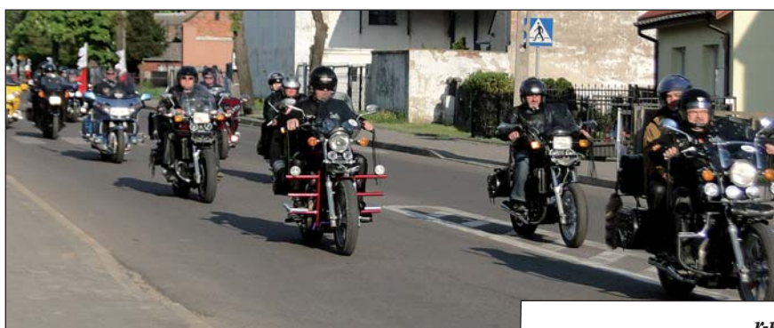
Na ulicach Raciąży