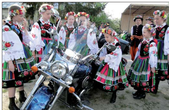
Nie mogło zabraknąć zespołu Krajkowiacy