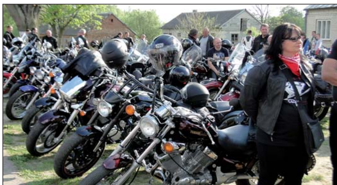
„Zbiórka” przed kościołem w Krajkwie