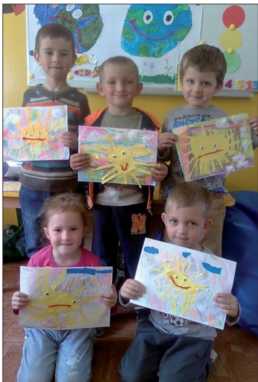
Na zdjęciach dzieci ze swoimi pracami

wym papierze. Następnie wycinały i przyklejały elementy na kartkę. Ogonki ze skręconej bibuły, nożki, uszy oraz słoneczko i chmurki wycięte również samodzielnie. Trawka zrobiona z bibuły);