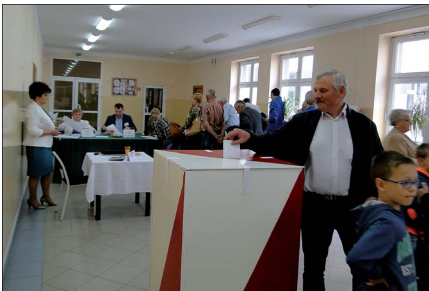
Lokal wyborczy w ZS w Raciążu