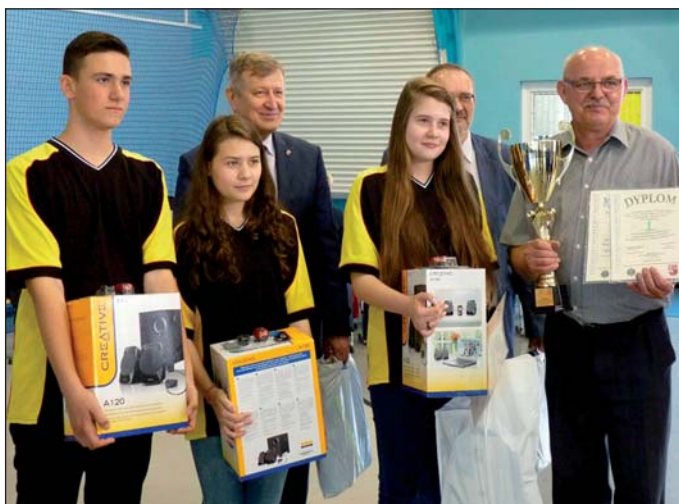
Gimnazjaliści Gralewa wygrali finał powiatowy, ale rywalizację w turnieju BRD zakończyli na szczelbu rejonowym

W Sochocinie odbył się powiatowy finał XXXVIII Turnieju Bezpieczeństwa w Ruchu Drogowym. W zawodach wzięły udział 24 drużyny (w sumie 84 uczniów) ze szkół podstawowych i gimnazjalnych z terenu pow. płońskiego. Gimnazjaliści z Gralewa nie zawiedli. Ekipie z podstawówki poszło trochę gorzej.