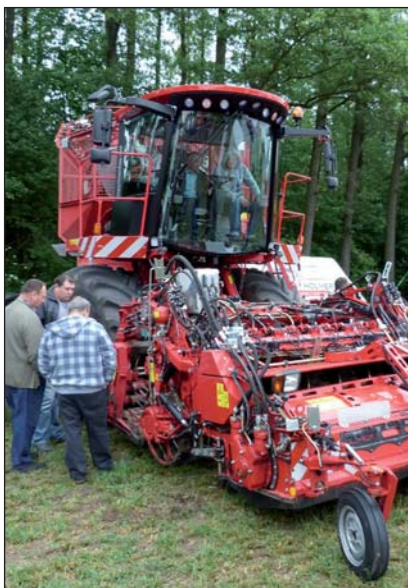
Na wystawie maszyn rolniczych było co oglądać i podziwiać

Na miejscu można było zasięgnąć porady ekspertów z zakresu uproszczonych technologii uprawy gleby, żywienia zwierząt wysłokami, nawożenia i ochrony buraków cukrowych. Nie zabrakło również konkursów z atrakcyjnymi nagrodami. Jak zawsze dużym zainteresowaniem cieszyły się nowoczesne systemy uprawy pozwalające na obniżenie jej kosztów.