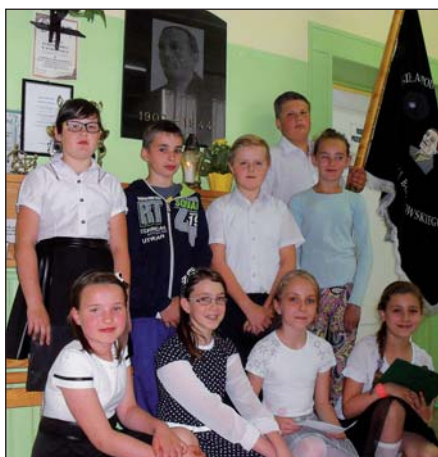
Pamiątkowa fotografia przy tablicy patrona ze sztandarem szkoły