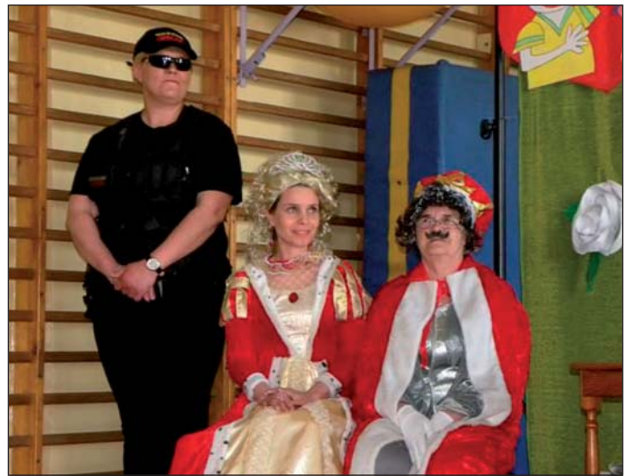
Kopciuszek w wykonaniu dorosłych