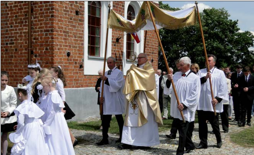
Uroczystą sumę zakończyła procesja wokół kościoła

W ostatnią niedzielę maja parafia w Krajkowie przeżywała doroczny odpust św. Trójcy. Po uroczystej sumie na placu przed kościołem odbył się festyn, na który złożyły się: krótki wykład o uzależnieniach, zabawy dla dzieci z okazji Dnia Dziecka, loteria fantowa (dochód na zespół "Krajkowicy"), promocja książki "Duszpasterze parafii Krajkowo". Muzyczną stronę imprezy poprowadził klerycki zespół z Płocka – Fratres.