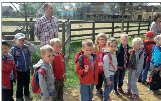
Podczas pobytu w Sarnowej Górze