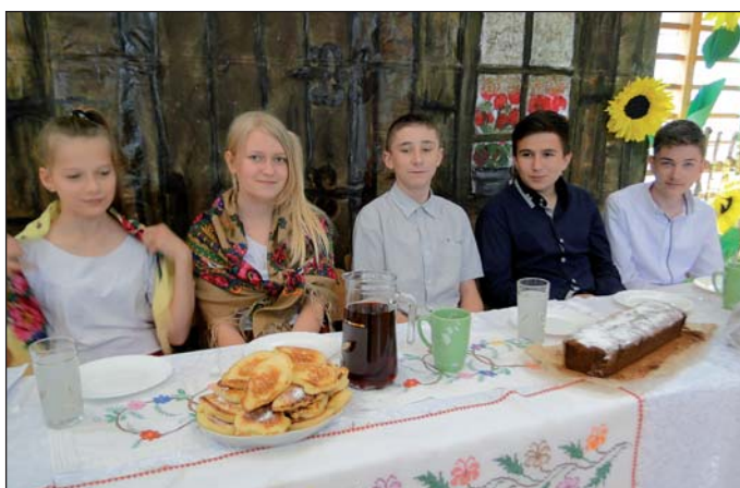
... stół biesiadny nakryty haftowanym obrusem...