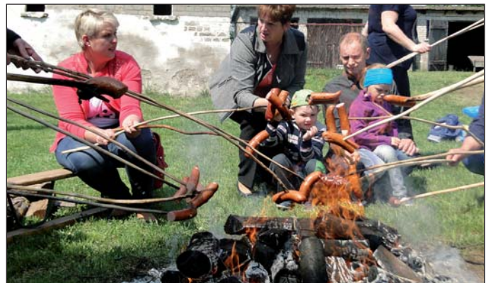
Kielbaski prosto z ogniska