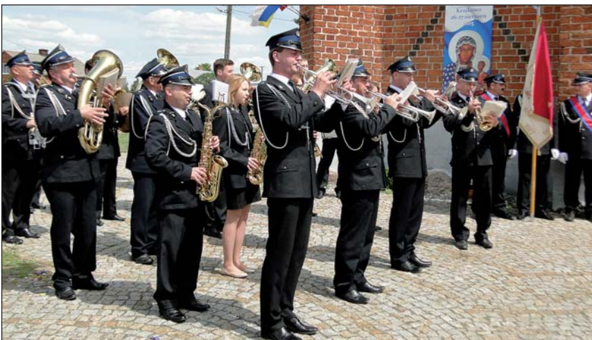
Nie mogło zabraknąć strażackiej orkiestry dętej