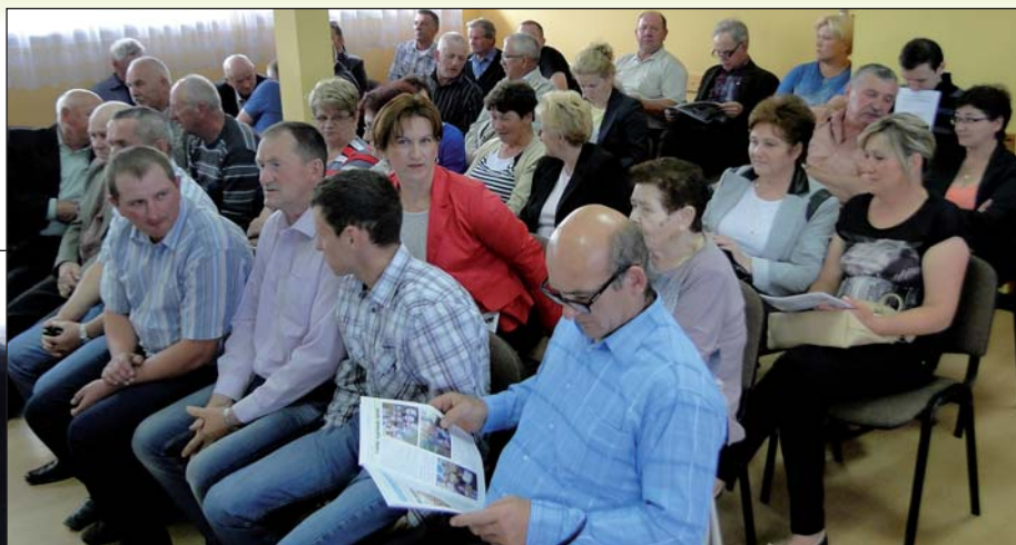
W sesji jak zwykle uczestniczyli sołtysi