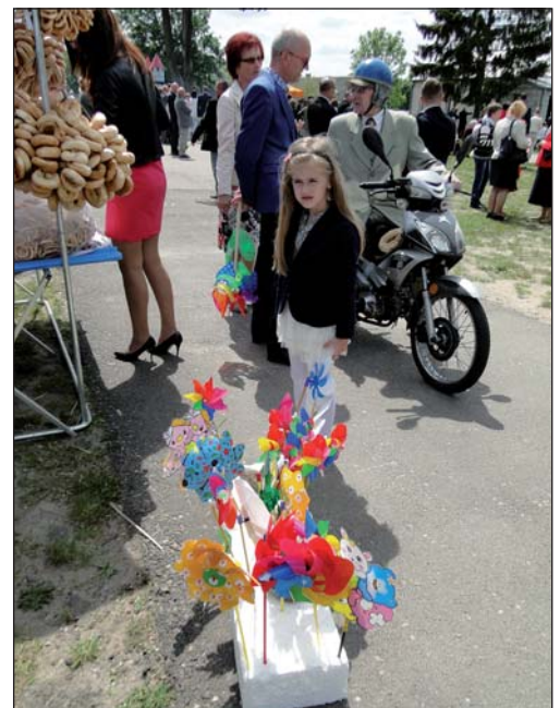
Na straganach kusily obwarzanki i kolorowe wiatraczki