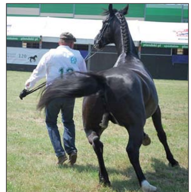
Obrazek z prezentacji zwierząt hodowlanych