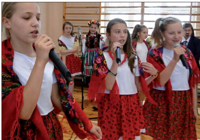
Były śpiewy i przyspiewki...

Dwa dni wpisały się szczególnie w historię szkoły – 1 czerwca 2001 r., kiedy dołączyła ona do grona szkół noszących imię Władysława Stanisława Reymonta oraz 1 czerwca 2006 r., gdy szkole nadano sztandar. Co roku na początku czerwca SP w Koziębrodach obchodzi Dzień Patrona. Nie inaczej było i tym razem.