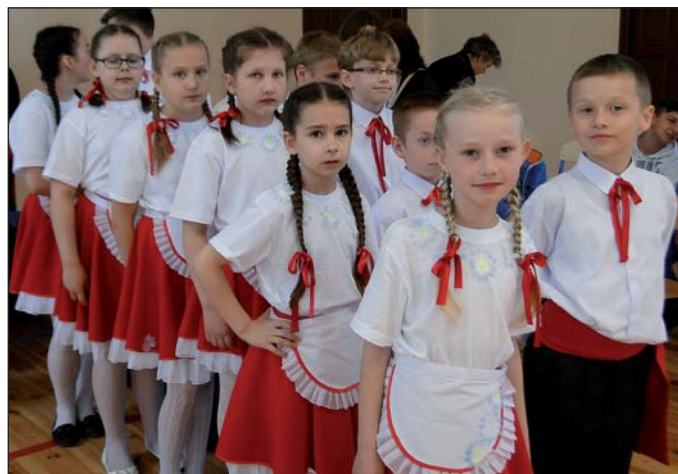
... tańce (zaraz rozbrzmi polka)...