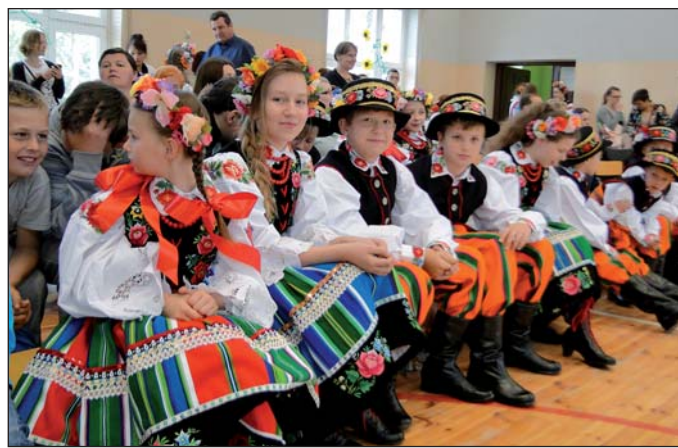
... i ludowa atmosfera...