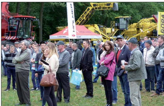
Impreza cieszyła się dużym zainteresowaniem