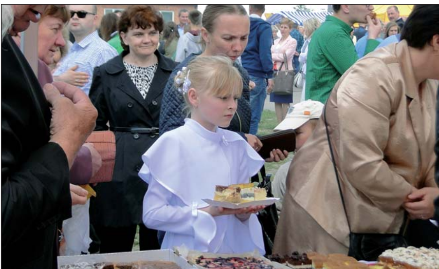
Dużym powodzeniem cieszyły się ciasta wypieczone przez krajkowskie gospodynie