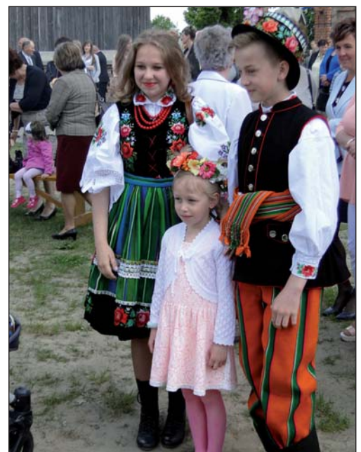
Można było sfotografować się z Krajkowiakami